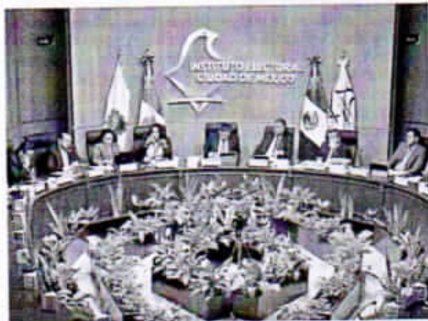
Las quejas e intercambio de acusaciones dominaron ayer la sesión en el Instituto Electoral de la Ciudad de México.