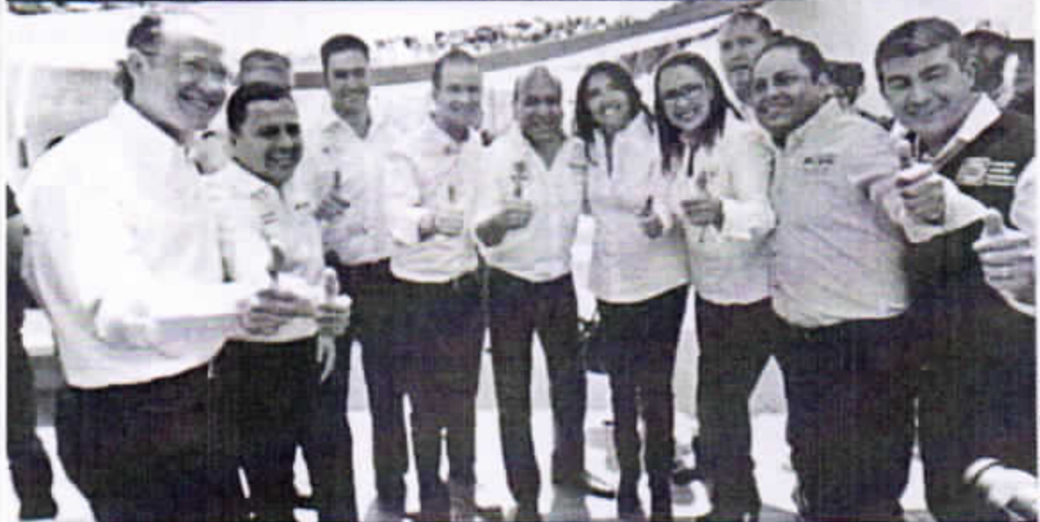
AGUA Y ACEITE. Hace 3 años era impensable, pero ayer panistas y perredistas compartieron foro, discurso y porras.